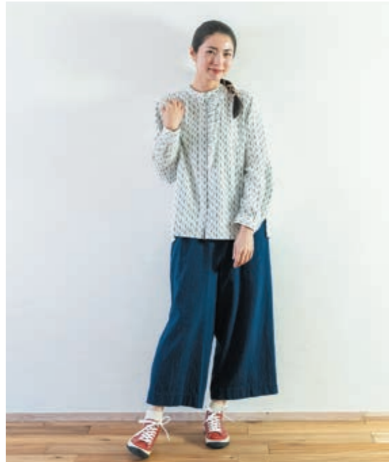
ブラウス/①K80 藍染白緋楊柳, パンツ/①M28 藍染濃紺スラブ