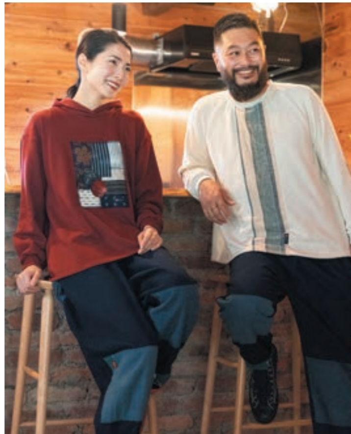
左：TS-55 ③レッド、右：TS-54 ④オフホワイト

綿100%【サイズ】M~L ■着丈：70cm ■身幅：60cm ■ゆき丈：80cm 9月下旬展開予定 ※柄柄は変更になる場合がございます。