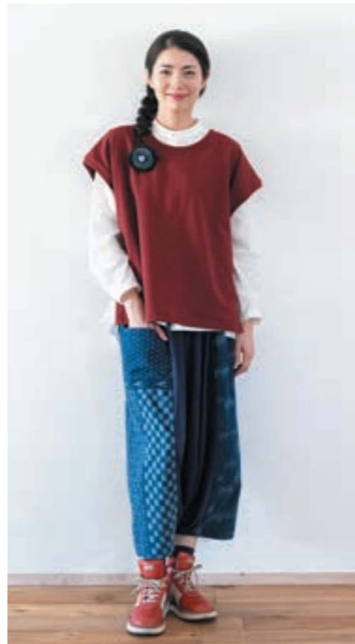
ベスト/①ワインレッド, パンツ/①K73 藍染マルチ拵柄