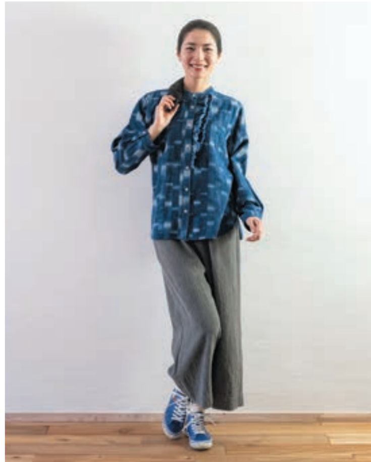
ブラウス/②K76 藍染ぼかし柄楊柳, パンツ/② M35 墨染墨スラブ