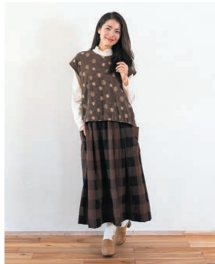
ベスト/①モカ, スカート/①ブラウン