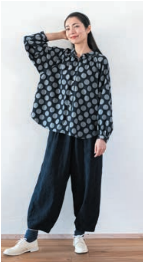
ブラウス/①濃紺×生成, パンツ/②濃紺×黒