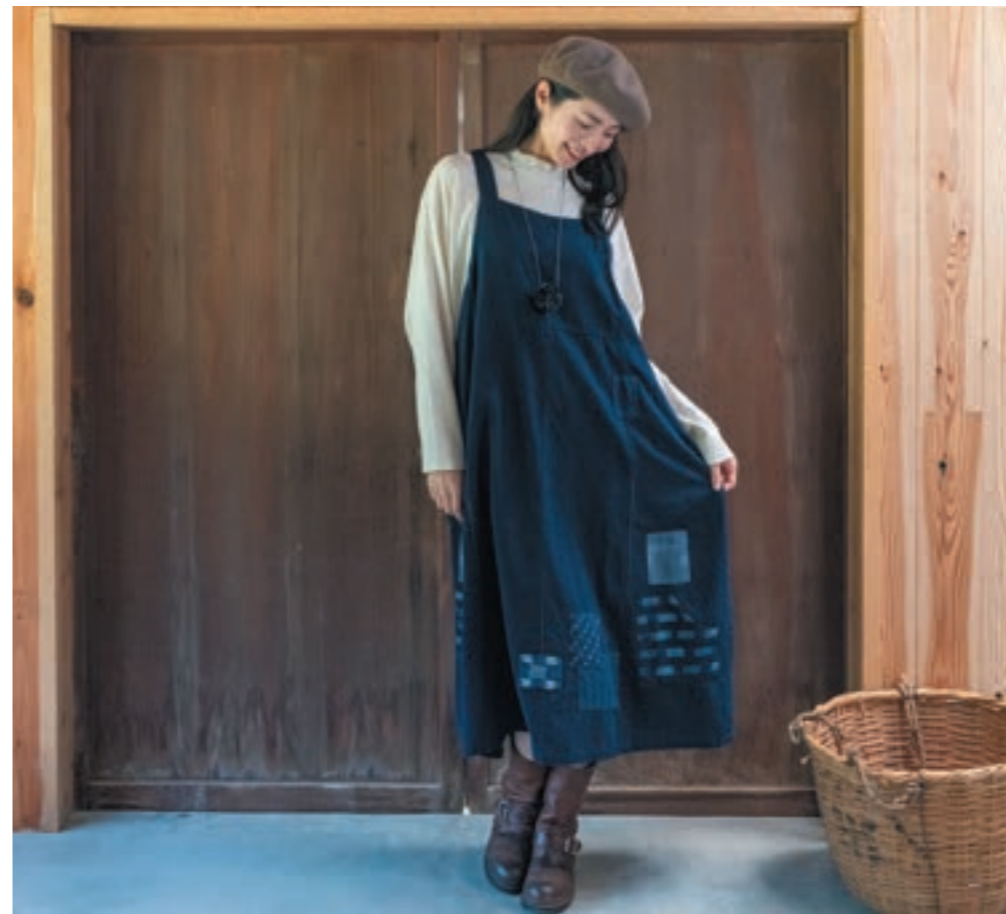
Tシャツ/①ミルク, スカート/ M7 藍染濃紺

商品コード CT-14 商品名 ステンカラーコート ¥52,800-(税込) 綿100%【サイズ】M~L ■着丈:90cm ■身幅:59cm ■ゆき丈:81cm 9月下旬展開予定