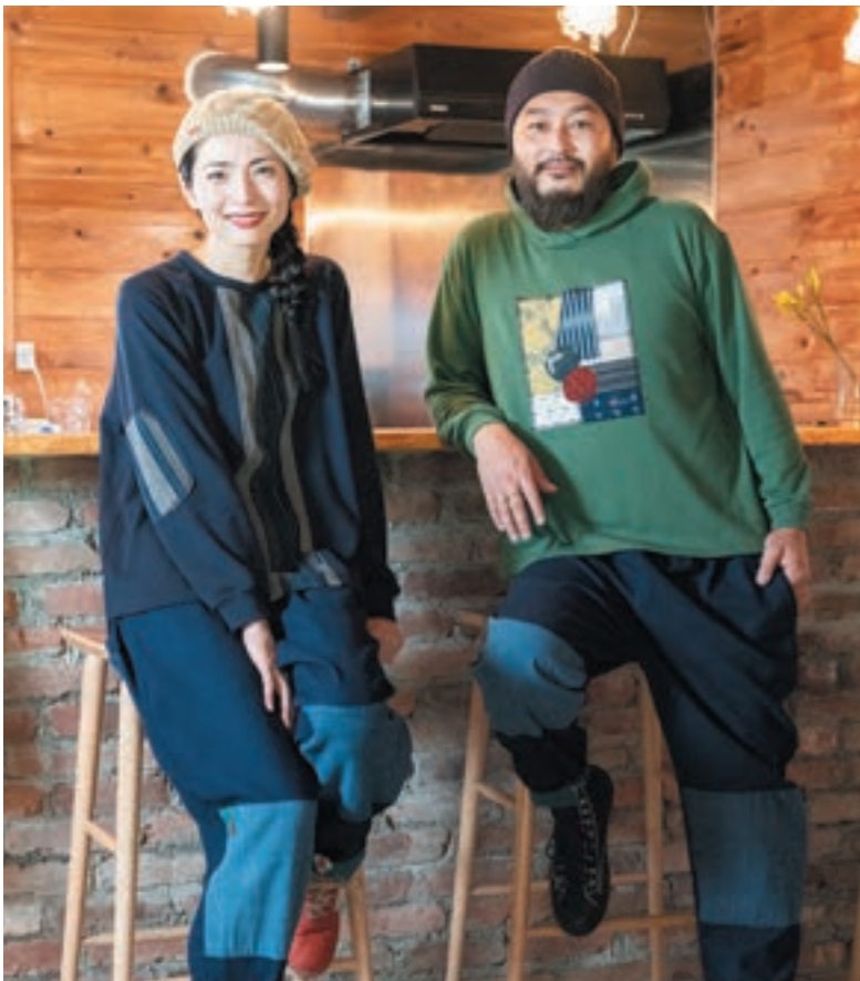
左：TS-54 ①ネイビー、右：TS-55 ②グリーン