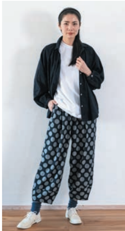
ブラウス/②濃紺×黒, パンツ/①濃紺×生成