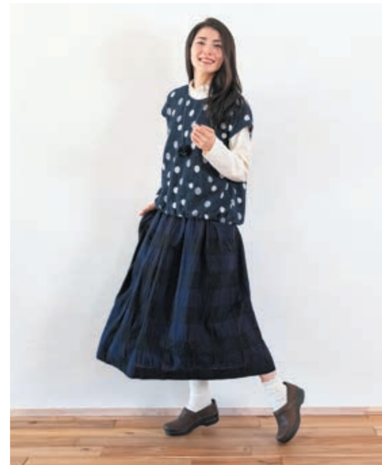
ベスト/②ネイビー, スカート/②ネイビー

毛58%綿42%【サイズ】M~L ■着丈：58cm ■身幅：57cm ■背肩丈：58cm 9月下旬展開予定