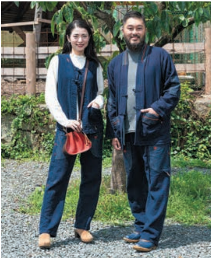
刺し子風デニム(綿100%)を全商品使用。