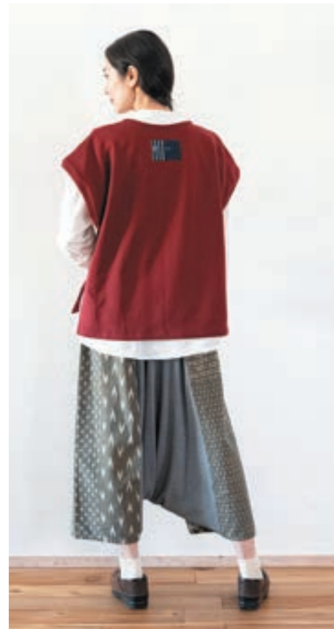
ベスト/①ワインレッド, パンツ/③K73ざくろ マルチ拵柄