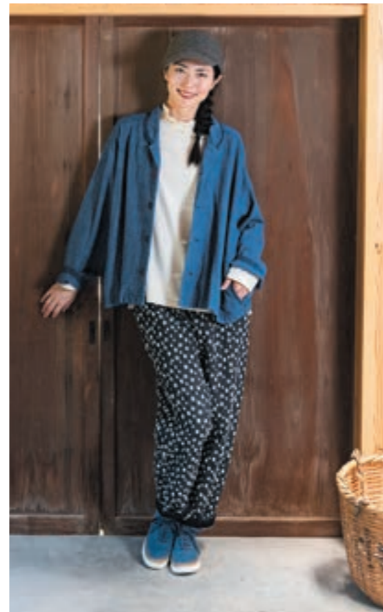
ジャケット/①K9 藍ダンガリー, パンツ/①インディゴ×白