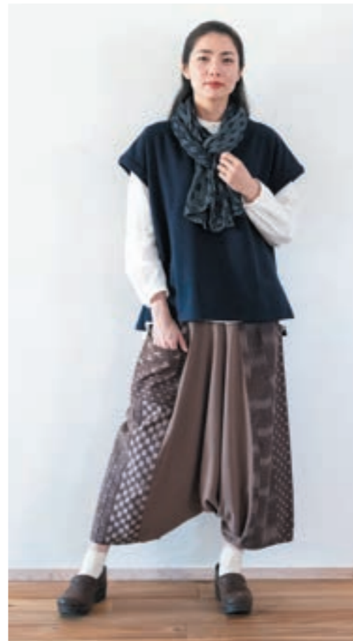
ベスト/②ネイビー, パンツ/②K73茶 マルチ拵柄

綿100% 【サイズ】M~L ■着丈:62cm ■身幅:61cm ■背肩幅:68cm