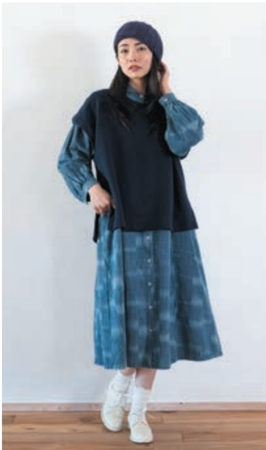
①K143 藍染たて白拵よこ藍 ¥50,600-(税込)