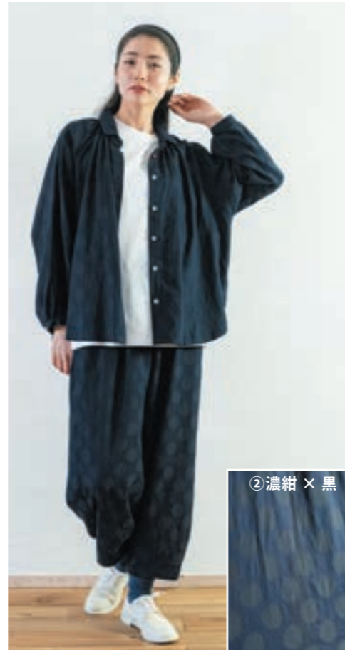
ブラウス・パンツ/②濃紺×黒