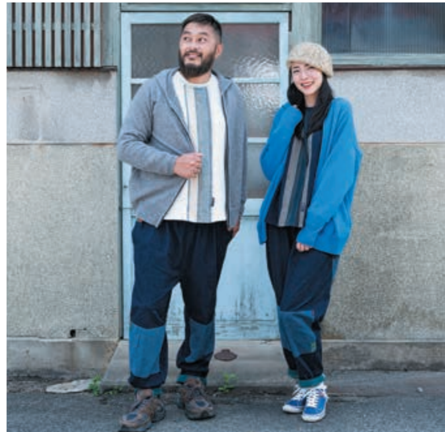
左：パーカー①グレー 右：パーカー②ブルー

綿100%【サイズ】M~L ■着丈：70cm ■身幅：60cm ■ゆき丈：80cm 9月下旬展開予定 ※柄柄は変更になる場合がございます。