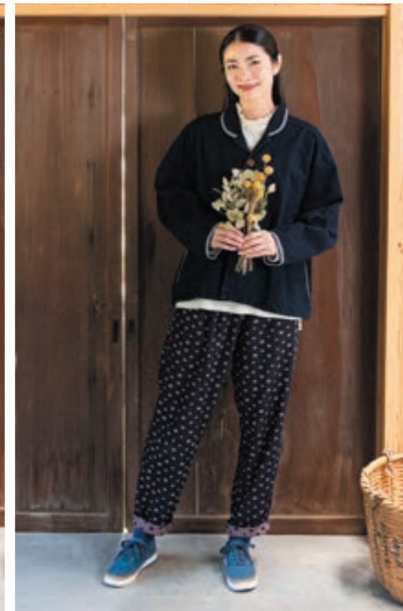
ジャケット/②刺し子デニム, パンツ/②インディゴ×ピンク

商品コード JKK-22 商品名 ドテラジャケット M~L ¥56,100-(税込) L~LL ¥60,500-(税込)