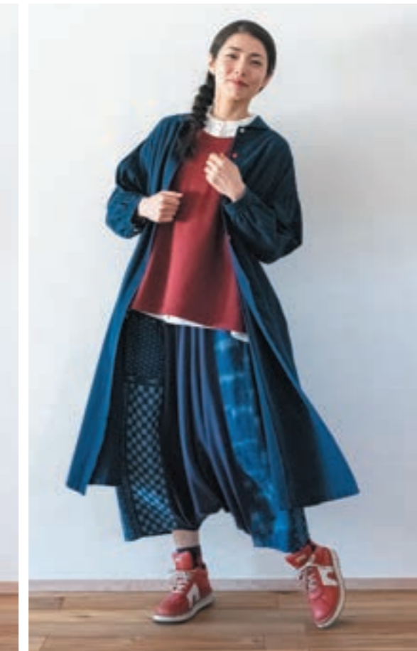
②M7 藍染濃紺 ¥39,600-(税込)

綿100% 【サイズ】M~L ■着丈:110cm ■身幅:61cm ■ゆき丈:76cm